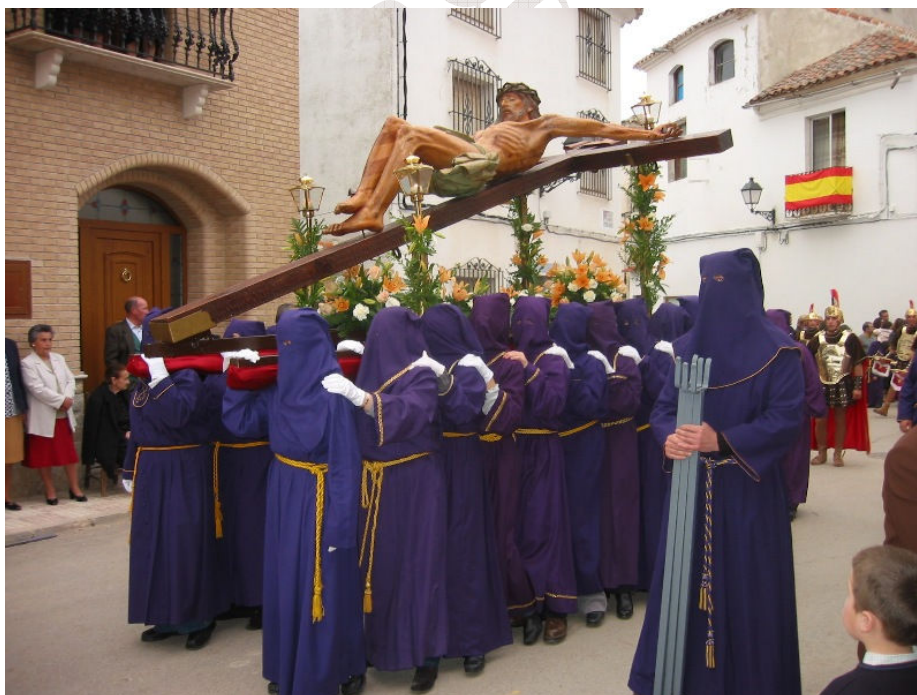
Villahermosa, Semana Santa de 2003. Imagen del Cristo en procesión

CASTILLA LA MANCHA.- Gran Enciclopedia de Castilla la Mancha. Tomo XI, página N° 2.923.