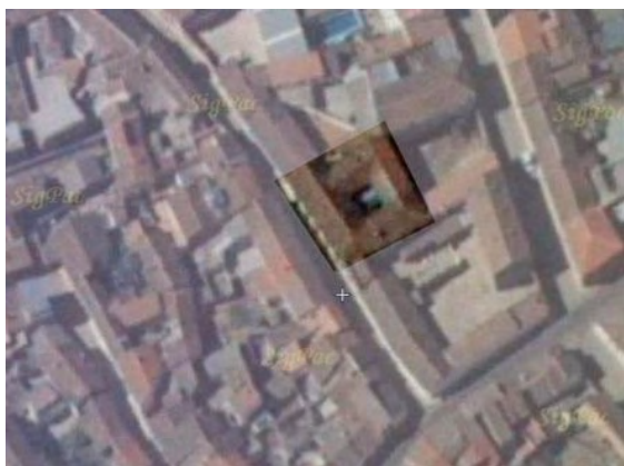
C/ Correos. Antiguo Asilo-colegio