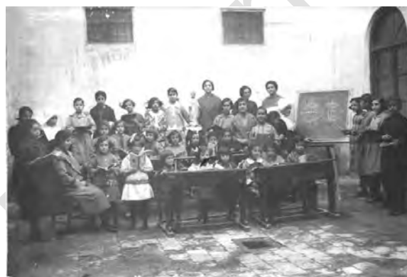
1924. Alumnos en el patio del Asilo-Colegio.