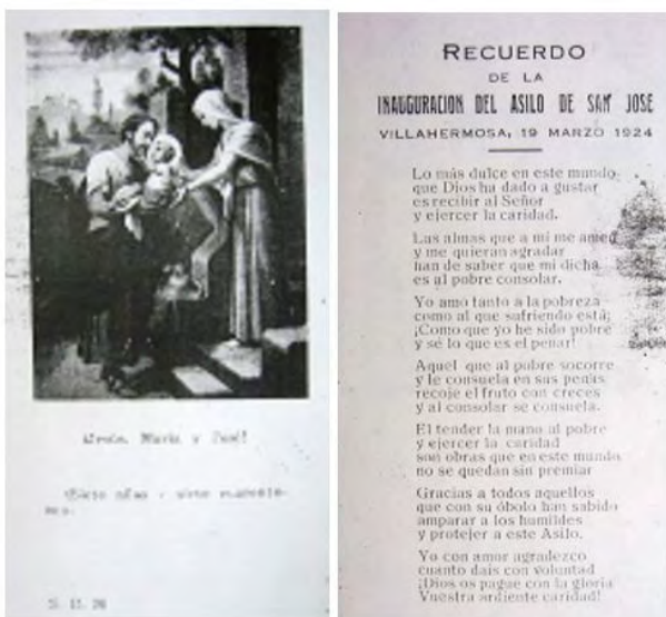
1924. Recordatorio de inauguración del Asilo de San José